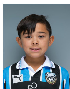
MF/DF 4 スetai - 大翔 小学3年 すてんぱー・るか・ひろと 133cm/28kg