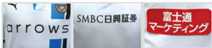
スポンサーマーク(胸・背中・左袖)