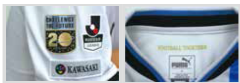
20thロゴマーク Jリーグマーク ホームタウン(KAWASAKI)マーク FOOTBALL TOGETHERマーク