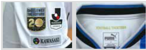
20thロゴマーク Jリーグマーク ホームタウン(KAWASAKI)マーク FOOTBALL TOGETHERマーク